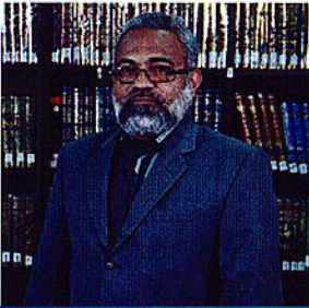
پستوی و حقوق دانان دیم کی پورتی دسیر بریوت