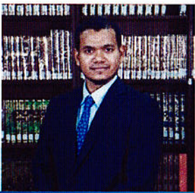
پستوی و حقوق دانان دیم کی پورتی دسیر بریوت