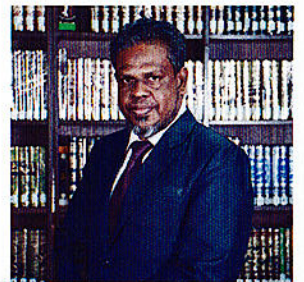
پستوی و حقوق دانان دیم کی پورتی دسیر بریوت