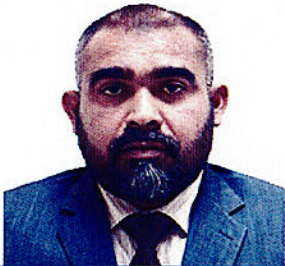
پستوی و حقوق دانان دیم کی پورتی دسیر بریوت