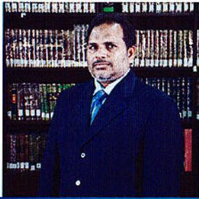
پستوی و حقوق دانان دیم کی پورتی دسیر بریوت