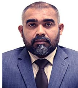
نایب رئیس هیئت مدیرهٔ سازمان اسناد و کتابخانه ملی جمهوری اسلامی ایران