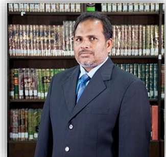
نایب رئیس هیئت مدیرهٔ سازمان اسناد و کتابخانه ملی جمهوری اسلامی ایران