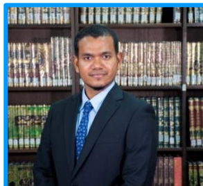
نایب رئیس هیئت مدیرهٔ سازمان اسناد و کتابخانه ملی جمهوری اسلامی ایران