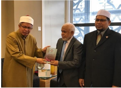
درياسي پي ايمو برسورتي اداري و اداري سرچ (22 حج و عمره 2018)