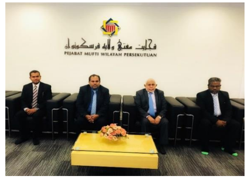
درياسي پي ايمو برسورتي اداري و اداري سرچ (17 حج و عمره 2018)