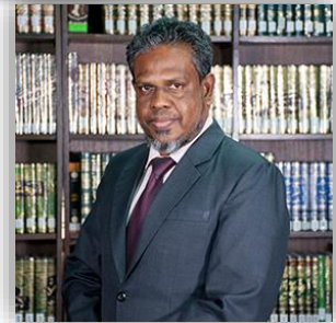
نایب رئیس هیئت مدیرهٔ سازمان اسناد و کتابخانه ملی جمهوری اسلامی ایران