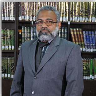
نایب رئیس هیئت مدیرهٔ سازمان اسناد و کتابخانه ملی جمهوری اسلامی ایران